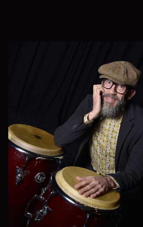
Antonio Algar Percusión